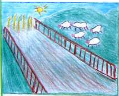
SPAZIO PASCOLI + SPAZIO COLTIVAZIONI

Ognuno di noi, consumando dei beni, lasciando sulla terra la sua impronta. L'impronta ecologica è la quantità di risorse naturali che un uomo, una popolazione o una nazione consuma in un anno. L'impronta comprende in tutte le superfici del mondo che vengono usate per produrre dei beni: superficie per le coltivazioni + superficie per i pascoli + superficie marina + superficie per le foreste + superficie per gli edifici dove abitiamo + passiamo la nostra giornata + superficie forestale, ma usiamo per assorbire i gas che alterano il clima. Queste superfici sono limitate e dobbiamo risparmiare per avere nuove due destinazioni per tutti!!