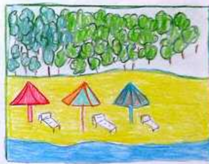
SPAZIO MARE + SPAZIO FORESTE